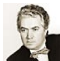
Пётр Глубокий бас