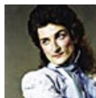
Валентин Дубовской тенор