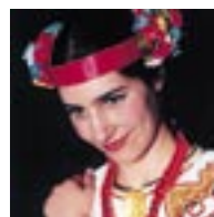
Оксана Лесничая сопрано